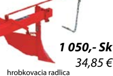
hrobkovaná radlica 1 050,- Sk 34,85 €