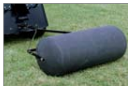
valec 7 900,- Sk 262,23 €