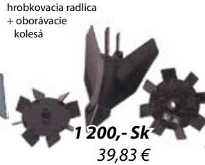
hrobkovaná radlica + oborávacie kolesá 1 200,- Sk 39,83 €