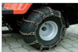
snehové retáže 3 500,- Sk 116,19 €