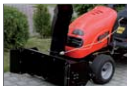
snehová fréza 62 900,- Sk 2 087,90 €