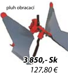
pluh obracací 3 850,- Sk 127,80 €