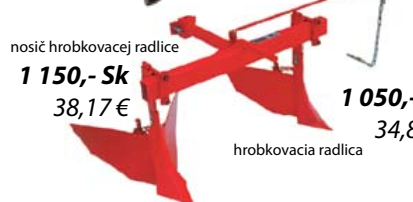
nosič hrobkovej radlice 1 150,- Sk 38,17 €