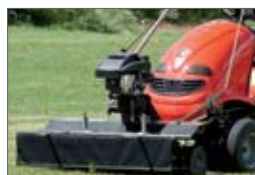
vertikutátor 62 900,- Sk 2 087,90 €