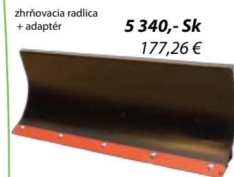
zhrňovacia radlica + adaptér 5 340,- Sk 177,26 €