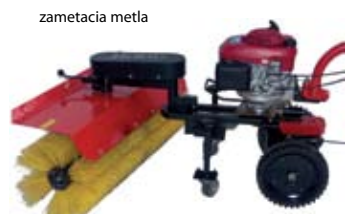
zametacia metla 30 550,- Sk 1 014,07 €