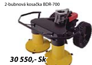
2-bubnová kosačka BDR-700 30 550,- Sk 1 014,07 €