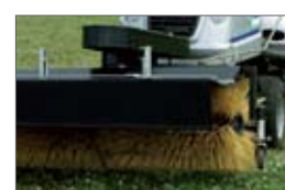
zametacia metla 59 900,- Sk 1 988,32 €