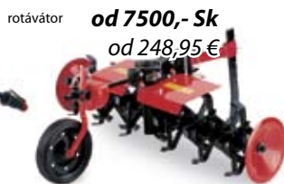
rotávátor od 7 500,- Sk od 248,95 €