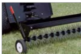
prezdušňovač 8 900,- Sk 295,43 €