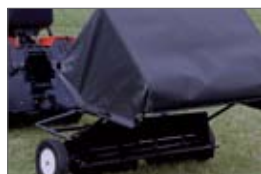
zberač lístia 25 000,- Sk 829,85 €