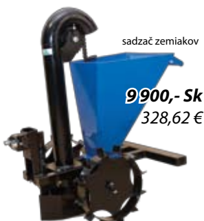
sádzač zemiakov 9 900,- Sk 328,62 €