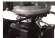
Ø spojky 80, 120 mm