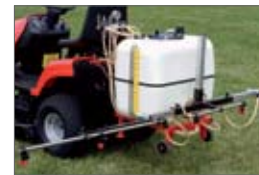
postrekovač 32 900,- Sk 1 092,08 €