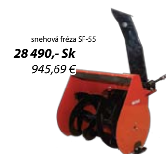
snegová fréza SF-55 28 490,- Sk 945,69 €