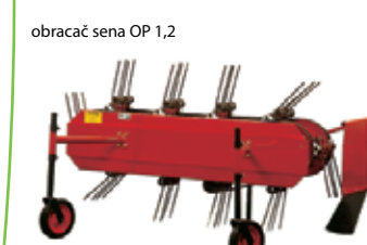
obracáč sena OP 1,2 19 490,- Sk 646,95 €