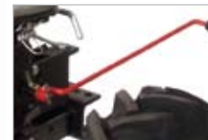
tažný záves (2,2 kN), záves na vozík