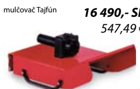
mulčovač Tajfún 16 490,- Sk 547,49 €