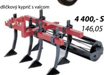
radličkový kyprič s valcom 4 400,- Sk 146,05 €