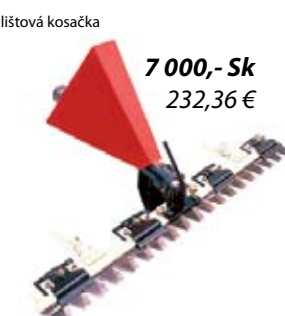
lišťová kosačka 7 000,- Sk 232,36 €