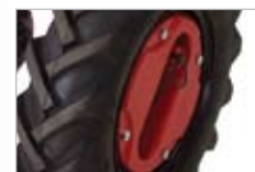
48 kg koleso