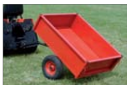
vozik 11 500,- Sk 381,73 €