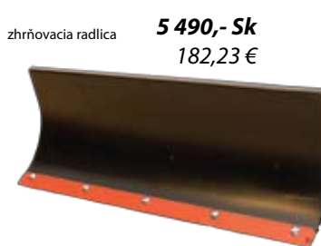
zhrňovacia radlica 5 490,- Sk 182,23 €