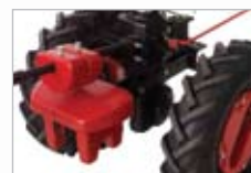
meniteľný rozchod kolies 480, 610 mm