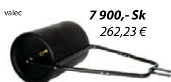
valec 7 900,- Sk 262,23 €