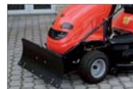
zhrňovacia radlica 9 900,- Sk 328,62 €