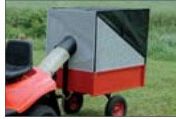
prídavný zberný kôš