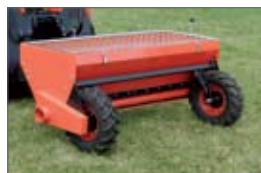
posýpač 19 990,- Sk 663,55 €