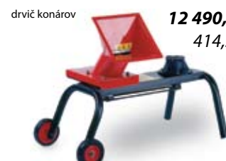
drvič konárov 12 490,- Sk 414,59 €