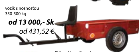
vozík s nosnosťou 350-500 kg od 13 000,- Sk od 431,52 €