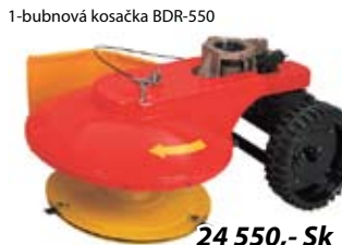
1-bubnová kosačka BDR-550 24 550,- Sk 829,52 €