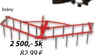
brány 2 500,- Sk 82,99 €