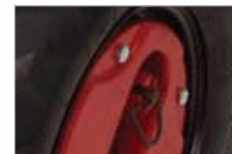
4 polohy uzávierky