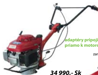
34 990,- Sk 1 161,46 €