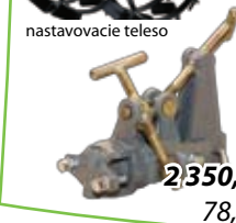
nastavovacie teleso 2 350,- Sk 78,01 €