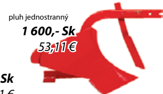
pluh jednostranný 1 600,- Sk 53,11 €