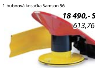
1-bubnová kosačka Samson 56 18 490,- Sk 613,76 €