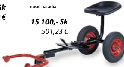
nosič náradia 15 100,- Sk 501,23 €