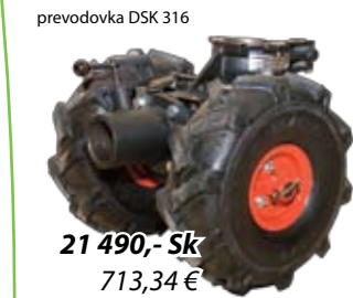
prevodovka DSK 316 21 490,- Sk 713,34 €