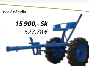
nosič náradia 15 900,- Sk 527,78 €