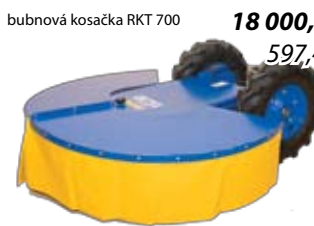
bubnová kosačka RKT 700 18 000,- Sk 597,49 €