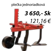
plečka jednoriadková 3 650,- Sk 121,16 €