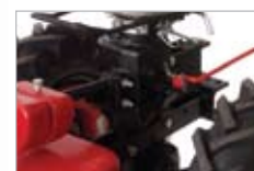
liatinová prevodová skriňa