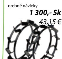
orebné návleky 1 300,- Sk 43,15 €