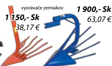
vyorávače zemiakov 1 900,- Sk 63,07 €