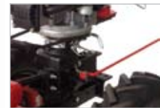
3 rýchlosti vpred, 1 vzad, obmedzovač