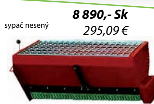
sypač nesený 8 890,- Sk 295,09 €